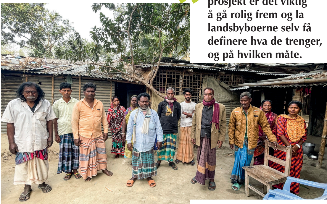
Artikkelen stod først på trykk i Ferskvare nr. 4-2025.

” I etableringen av nye prosjekt er det viktig å gå rolig frem og la landsbyboerne selv få definere hva de trenger, og på hvilken måte.