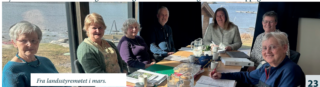
Fra landsstyremøtet i mars.