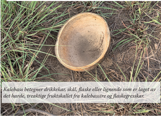
Kalebass betegner drikkekar, skål, flaske eller lignende som er laget av det harde, treaktige fruktskallet fra kalebastre og flaskegresskar.