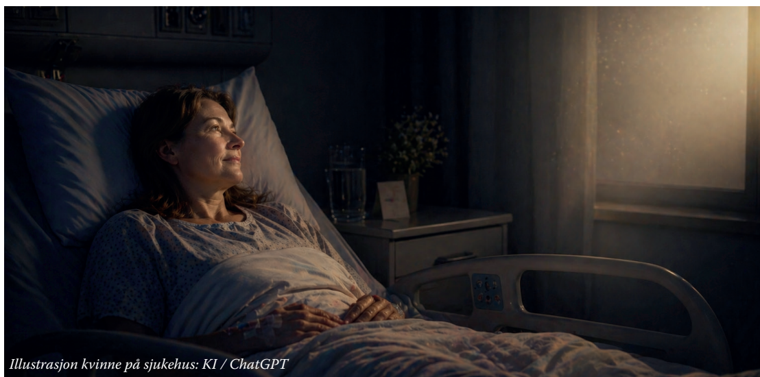
Illustrasjon kvinne på sjukehus: KI / ChatGPT