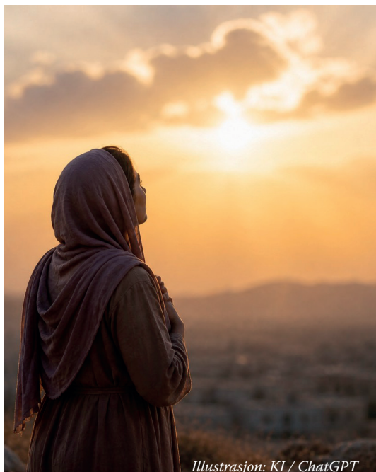
Illustrasjon: KI / ChatGPT

Vær gjerne med å be for oss som familie, for tålmodighet og hvilepuls i arbeidet vi står i. Be for relasjonene med vennene våre. At de skal komme med det de har på hjertet. Be for venninnene som jeg møter hver uke, for gode samtaler og at Jesus skal få skinne hver eneste gang.