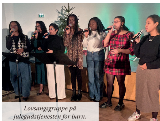
Lovsangsgruppe på julegudstjenesten for barn.

I tillegg har det vært flere dåp og vielser det siste året, og flere er planlagt. Det er spesielt gledelig å se unge voksne som ber om dåp og konfirmasjon og engasjerer seg – i tro og tillit. Vi har mye å være takknemlige for i Champigny. Tusen takk for bønnene deres, som gir oss styrke i hverdagen.