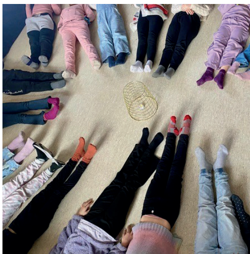
En gang i uka samles elevene til «leirbål».