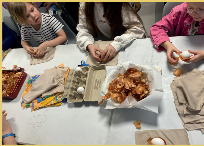
Barn farger egg med løkshall. Se også forsiden for bilde fra et av de mange besøkene fra skole- og barnehagebarn til kirken i Mustamäe.