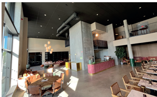
Inne i det nye bygget på Hedmarkstoppen.

Her håper vi å se mange, både tidligere og nye deltakere. Se mer informasjon om program og påmelding på side 16 og 17.