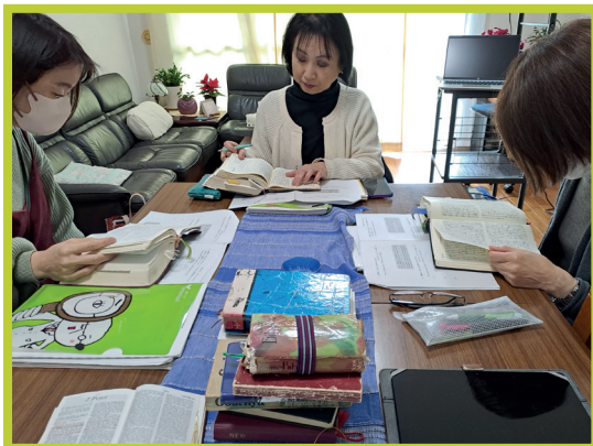
Samling med bibelgruppa.

Engelske bibelgrupper er ein god arbeidsreiskap i Japan. Det er mange som vil lære meir engelsk, og så får dei lære om Jesus gjennom bibeltekstane. Etter ei engelsk bibelklasse var eg ganske oppgitt.